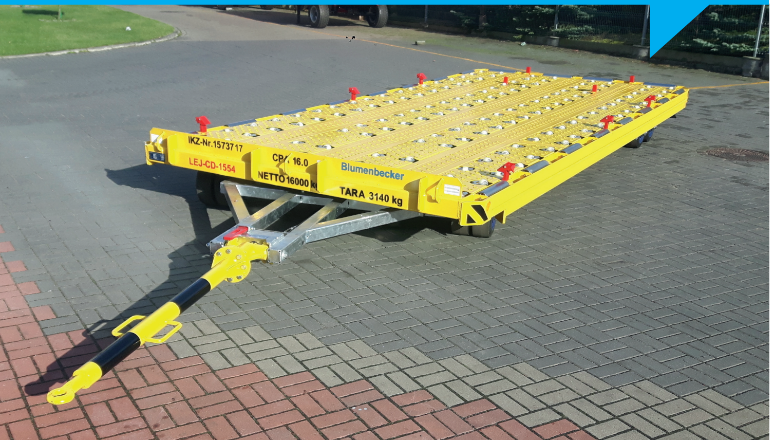
Abbildung: DOLLY D 20.101-C-DL

Der DOLLY D 20.101-C-DL der Blumenbecker Technik GmbH wurde für die Aufnahme von Lasten konzipiert. Die stabile Stahlkonstruktion hat eine maximal zulässige Zuladung von 16000 kg .