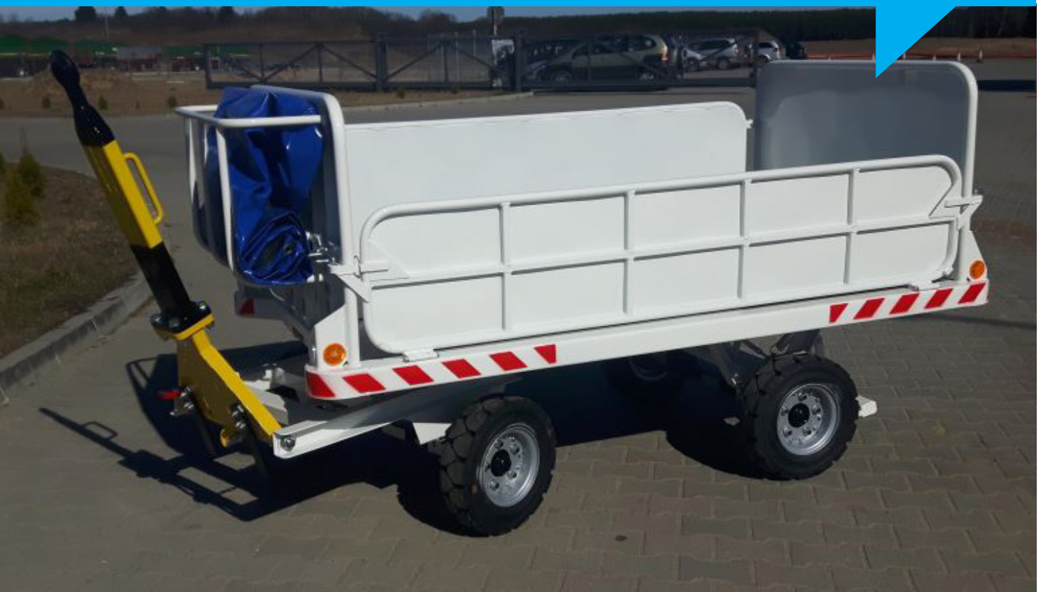
Abbildung: Frachtwagen FW 1500.001-W

Der Frachtwagen FW 1500.001-W der Blumenbecker Technik GmbH ist für den Transport von Frachtstücken und loser Ladung vorgesehen.